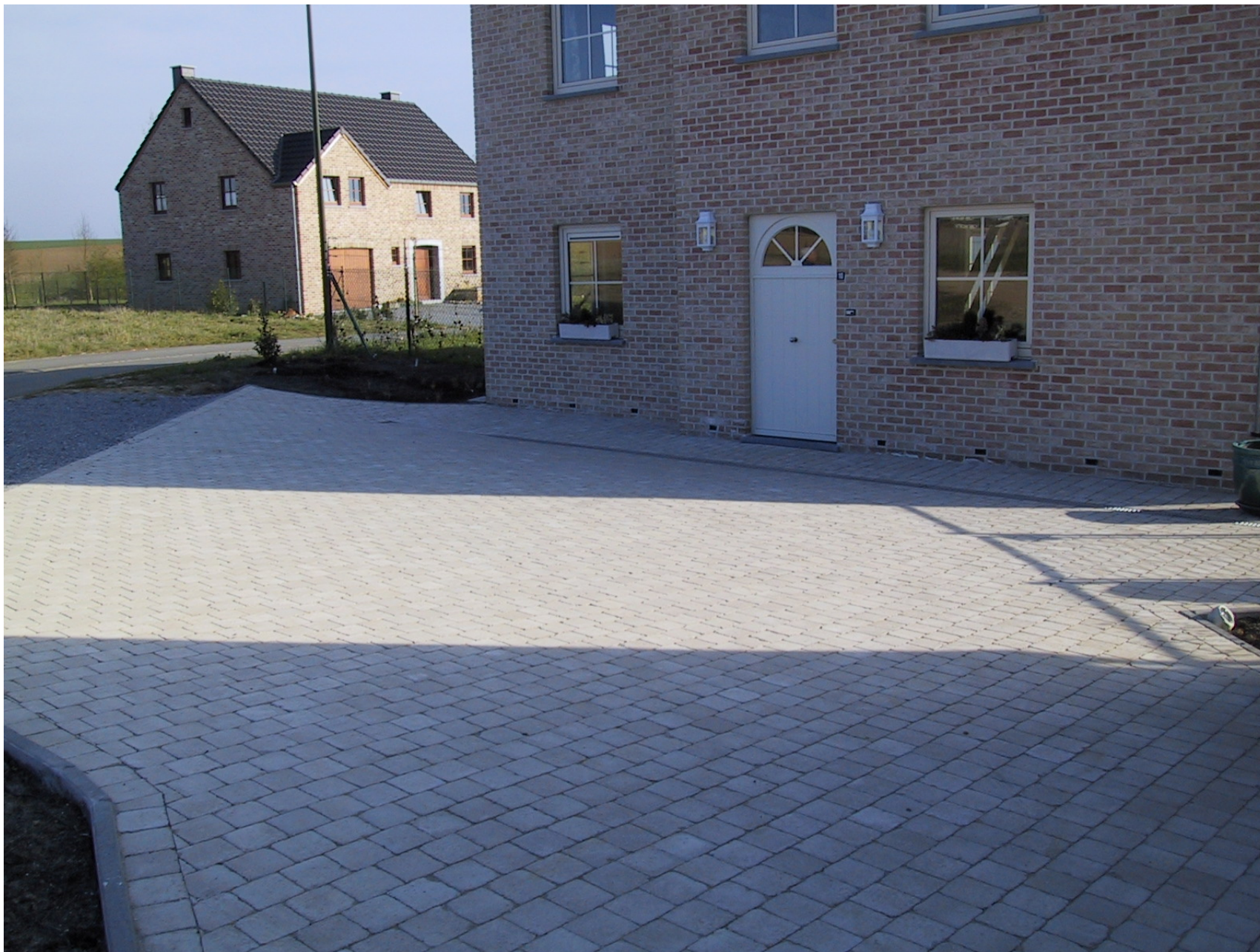
Pavage en pavés béton 15x15x6 – Bordure béton 100x20x6