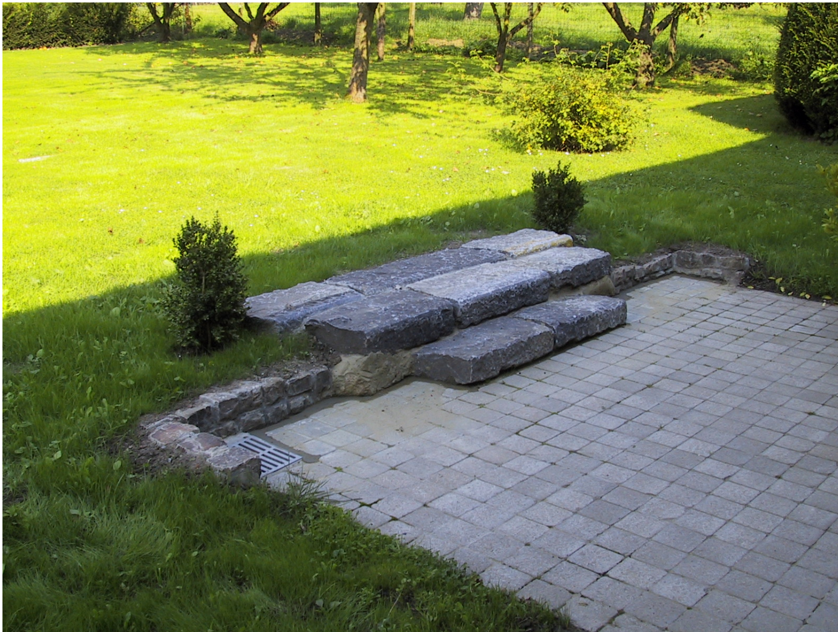
Réalisation d'un escalier – Bordure pierre bleue de récupération (Route)