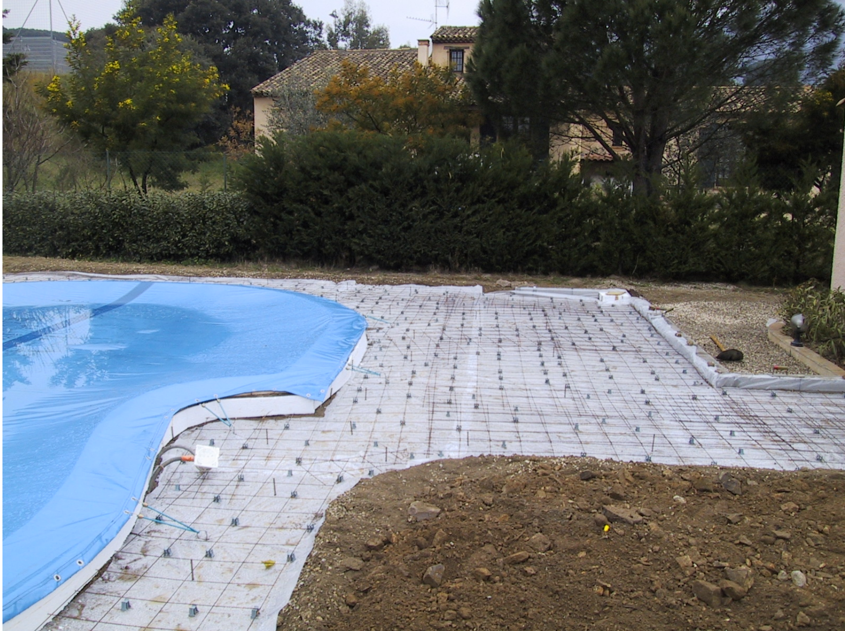
Ferrailage pour dalle de terrasse de piscine