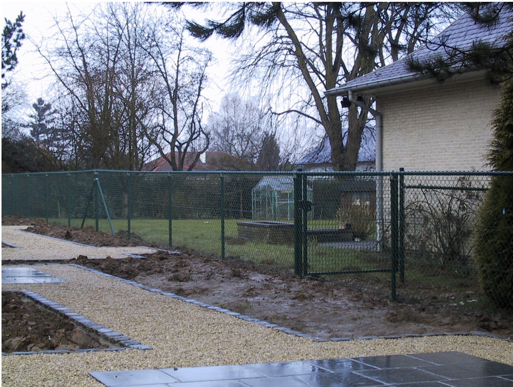
Clôture du type « Bekaert » plasitor, hauteur 1,5m, avec portillon et lisse de finition.