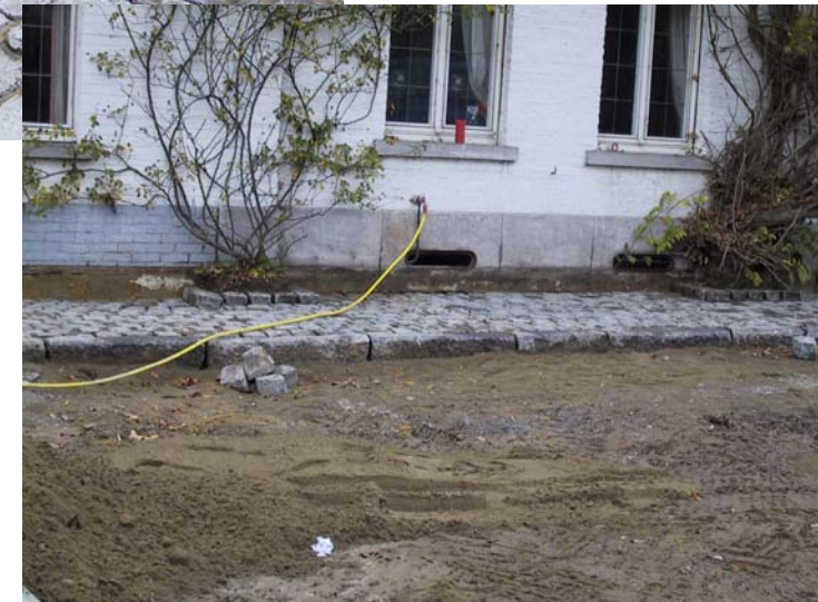
Pose de vieux pavés de récupération porphyre premier choix – 15x15