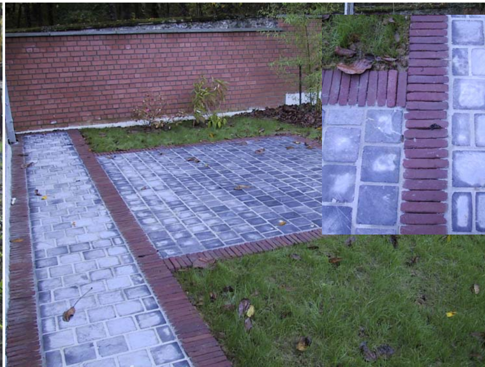
Chemin en Pierre Bleue Asiatique 15x15x2,5 Bordures en briquettes terre cuite béton 220x60x90 Contre marches Pierre Bleue Belge – Finition G220