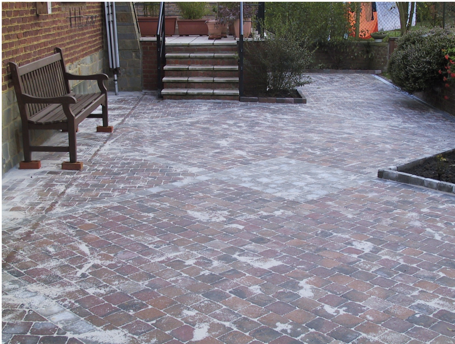
Terrasse en pavés béton 15x15x6 de couleur Automne avec frise et cadre en pavés gris