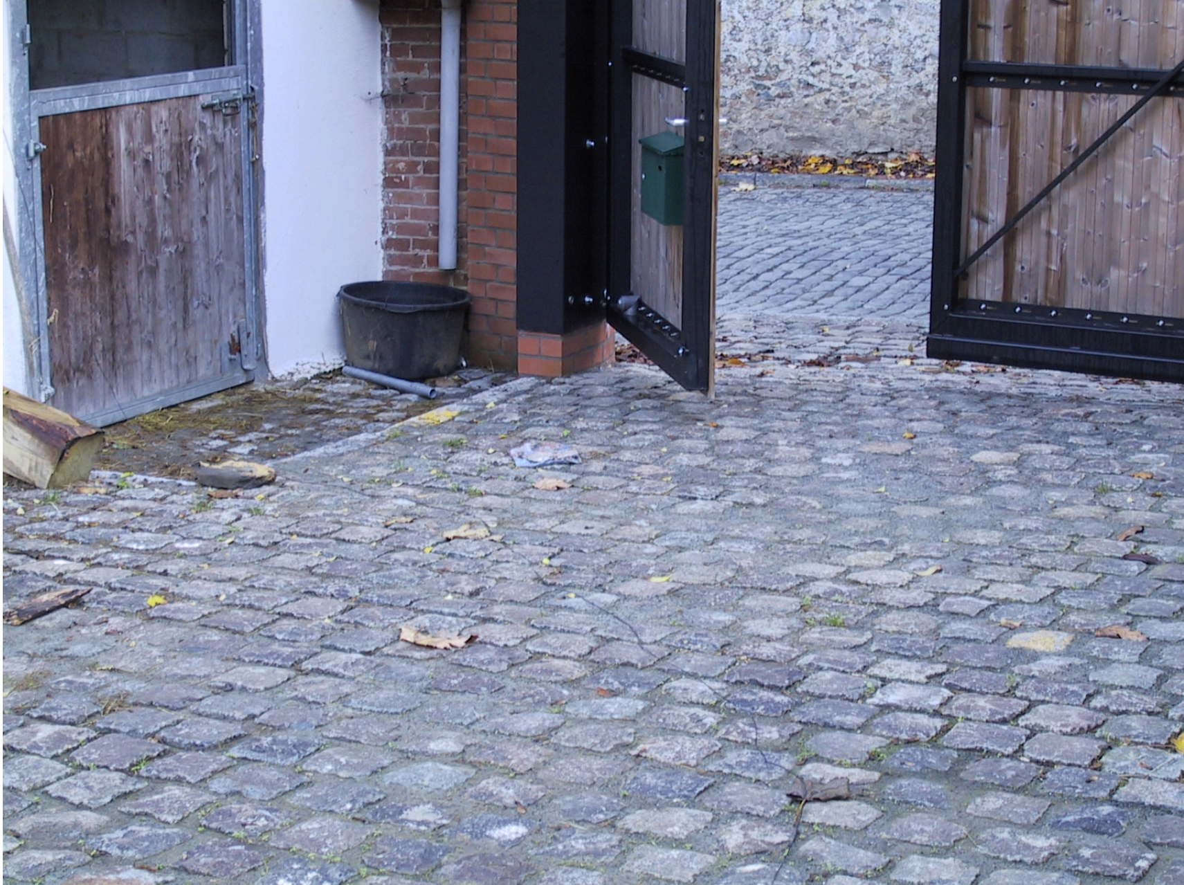
Pose de vieux pavés de récupération porphyre premier choix – 15x15