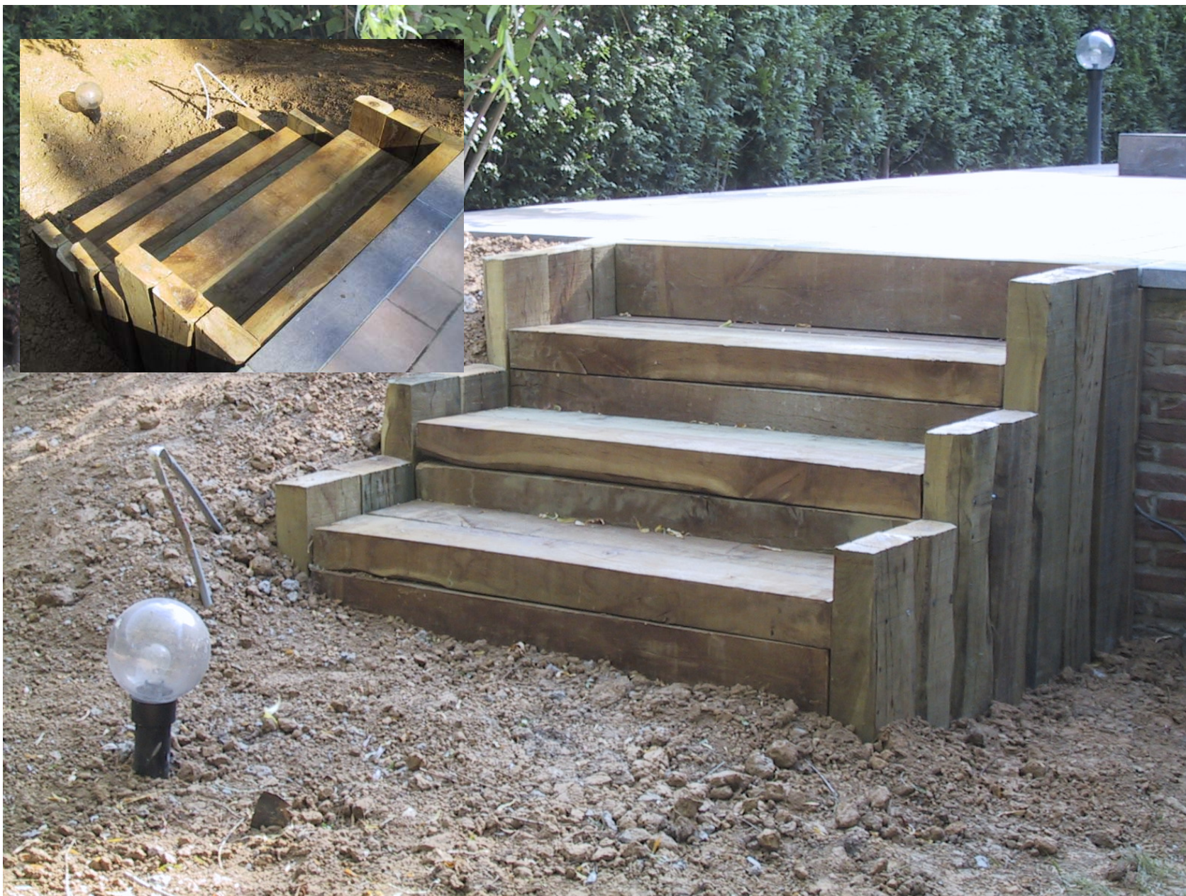
Réalisation d'un escalier – Billes en Chêne neuves (2 coins équarris)