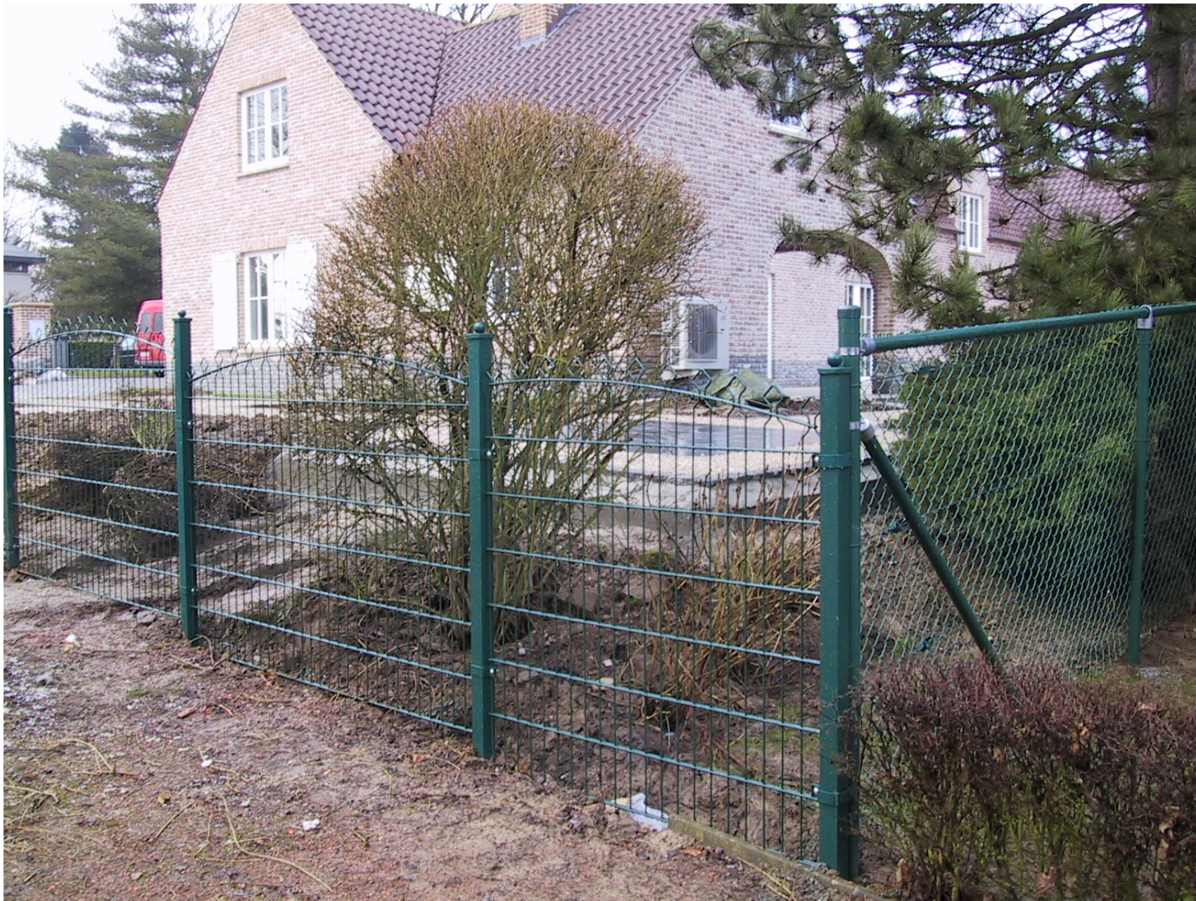
Clôture du type « Bekafor »