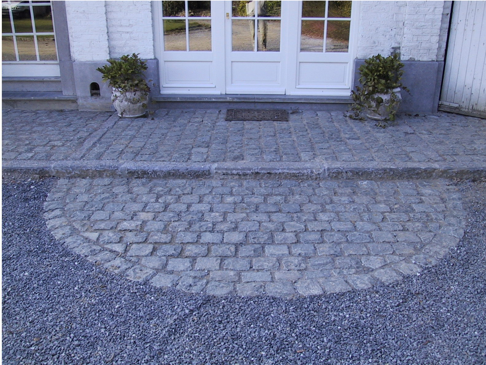
Pose de vieux pavés de récupération porphyre premier choix – 15x15 Bordure de récupération pierre bleue