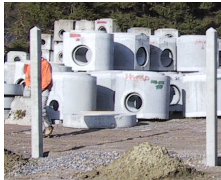
Pose de clôture – Piquet béton