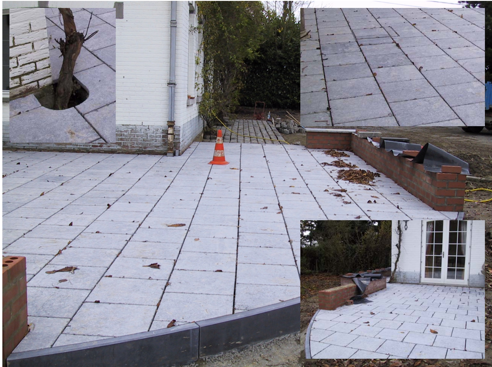
Terrasse en Pierre Bleue du Hainaut 40x40x3 – Finition adoucie