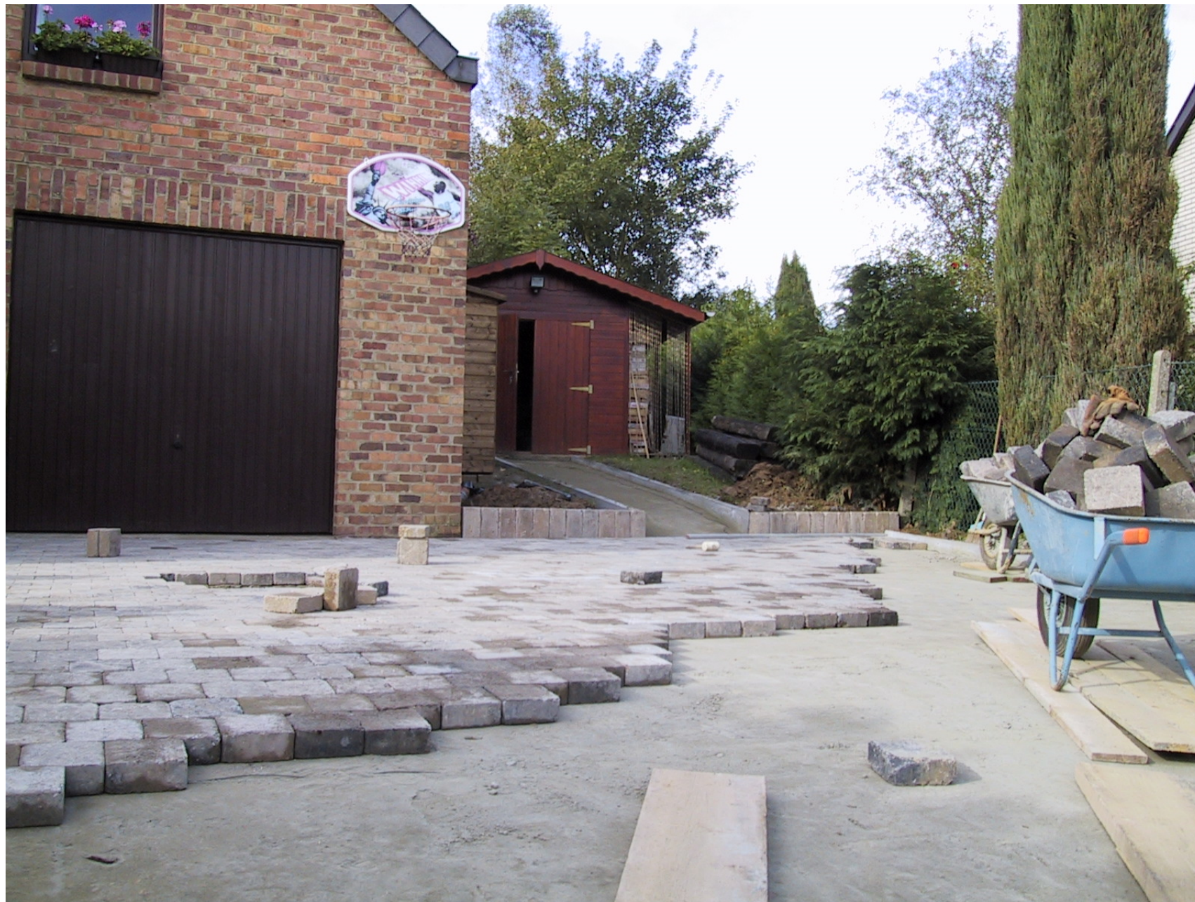
Pavage en béton 15x15x6 – Bordures en béton 100x20x6 – « Billes » béton 15x15x80