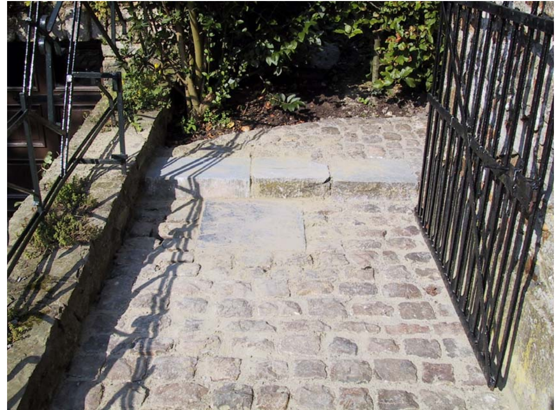
Vieux pavés Bordure en béton 100x20x6 Pose de pierres de récupération