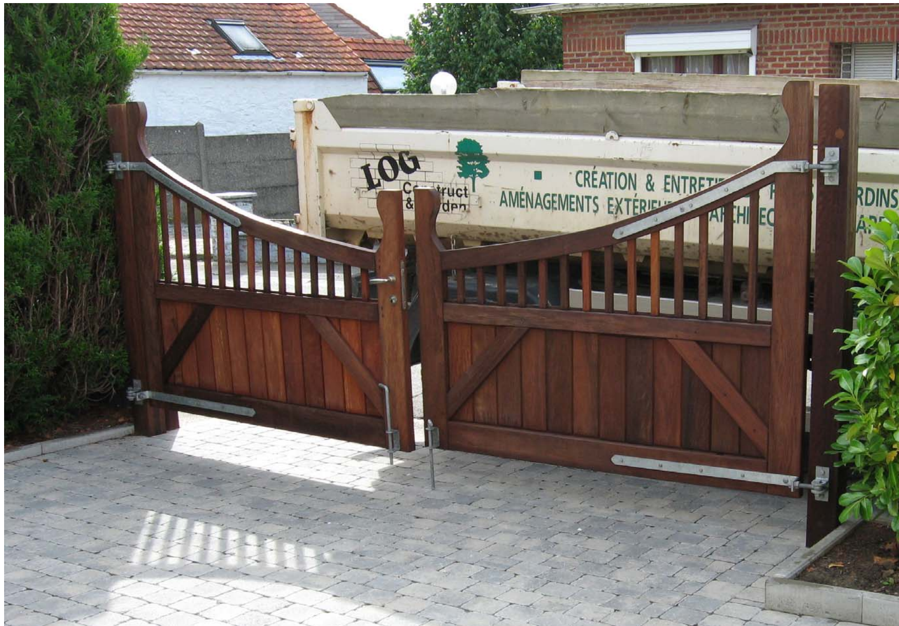
Portail en bois exotique (Padouk)