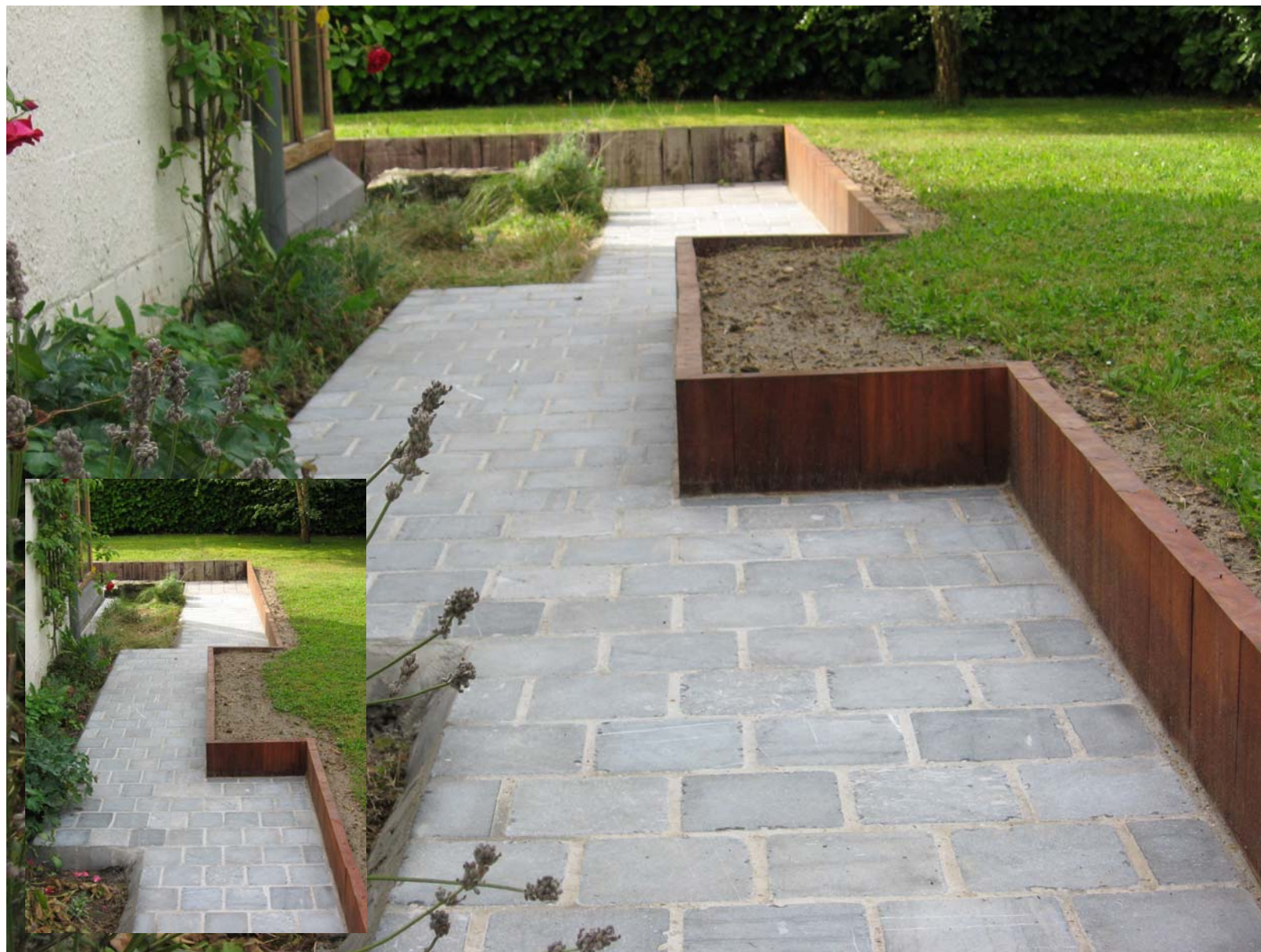
Pierre bleue Asiatique, format 15x15 , palanches en Azobé (Ep. 6cm)