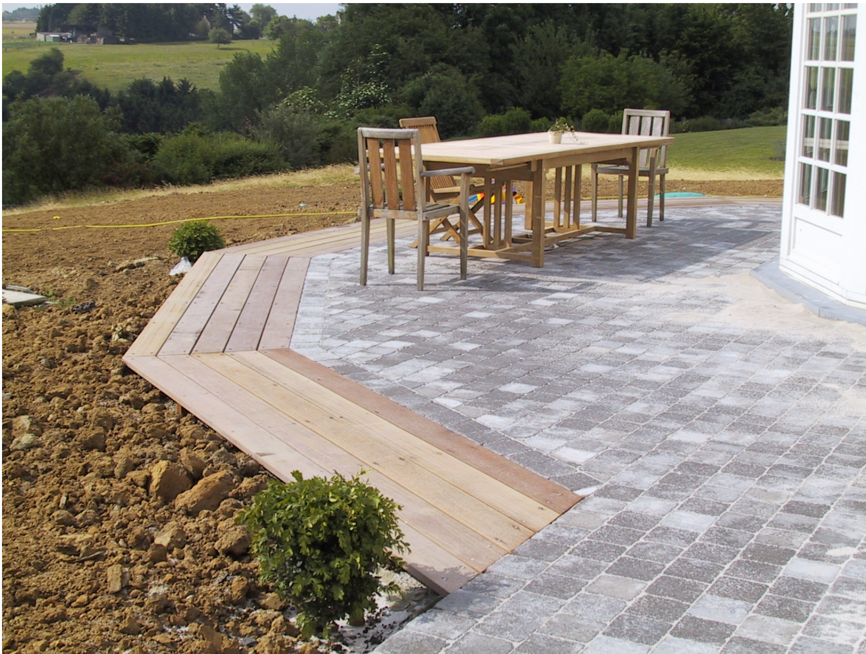
Terrasse en bois « IPE » avec fixations visibles en Inox et terrasse en pavés béton 15x15x6