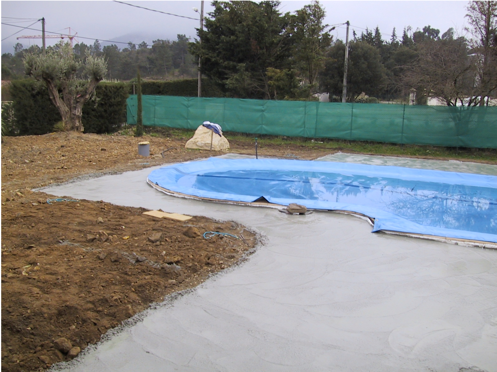
Dalle de béton – Finition légère pour pose de dalles