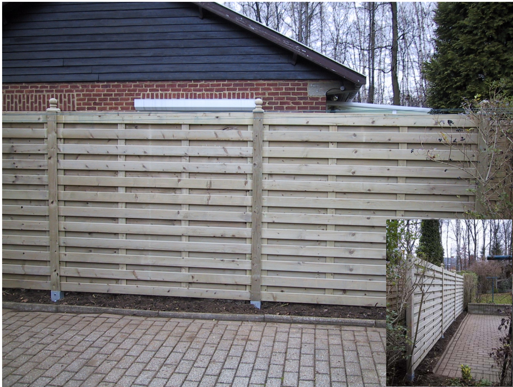
Réalisation d'un écran à l'aide de panneaux en Pin (Type lourd – fixation Inox)