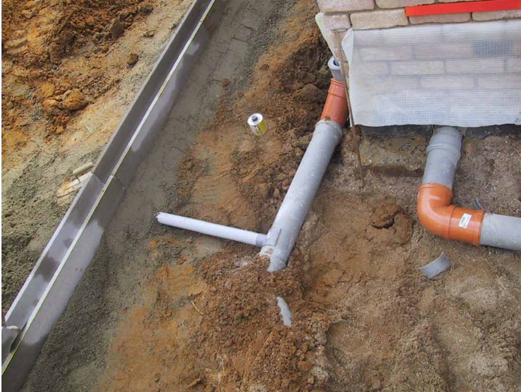
Pose de caniveaux en béton 100x14x13 Egouttage