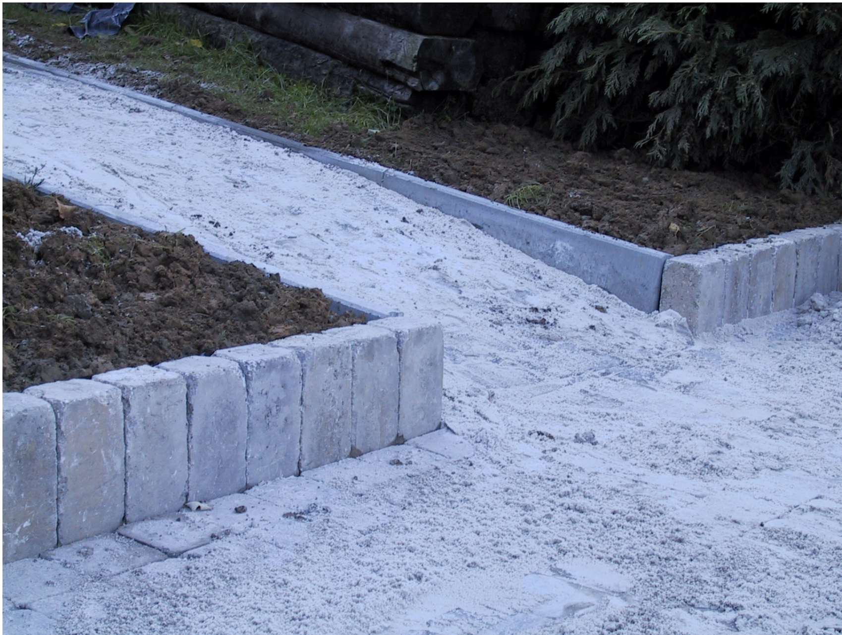
Pavage en béton 15x15x6 – Bordures en béton 100x20x6 – « Billes » béton 15x15x80