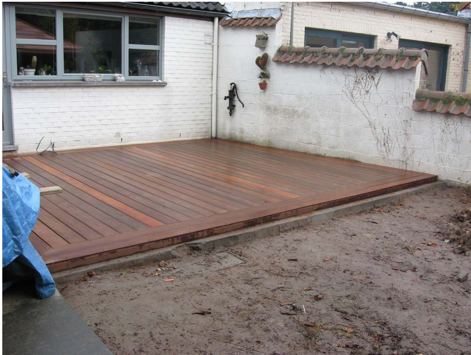
Terrasse en bois « IPE » avec fixations invisibles en Inox et planches de bordures