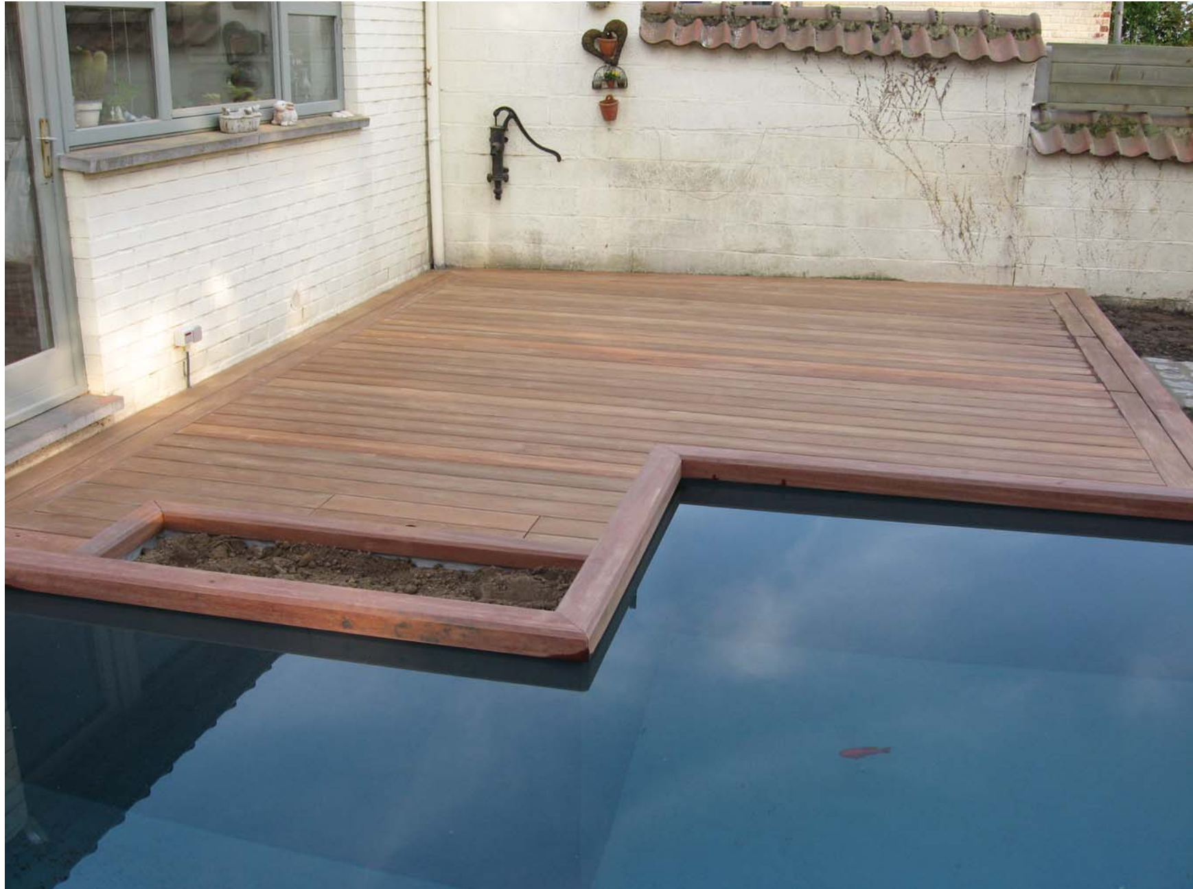
Terrasse en bois « IPE » avec fixations invisibles en Inox et planches de bordures