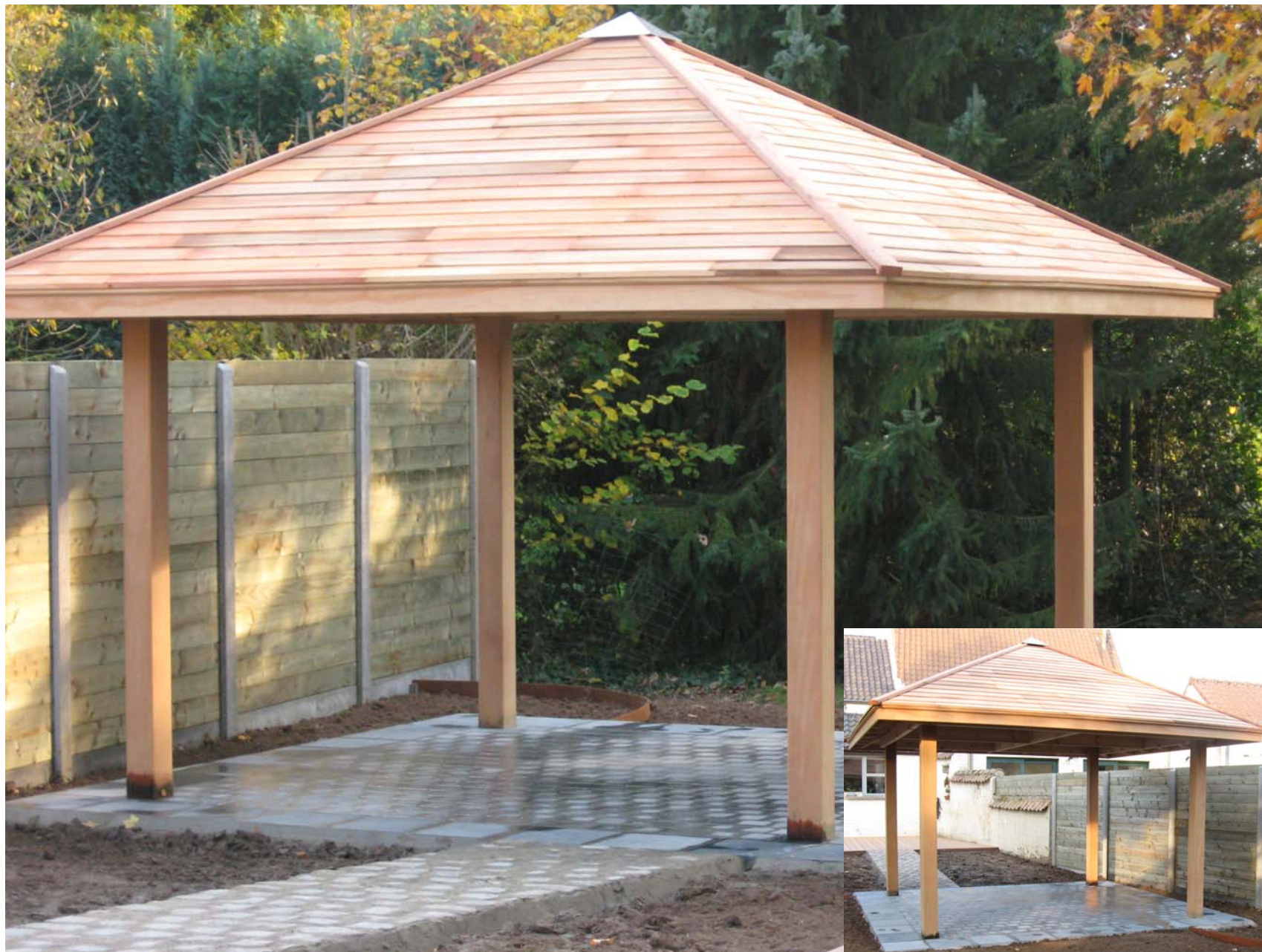
Tonnelle (Pergola) en sapin rouge du Nord, couverture en bardage de Cèdre.