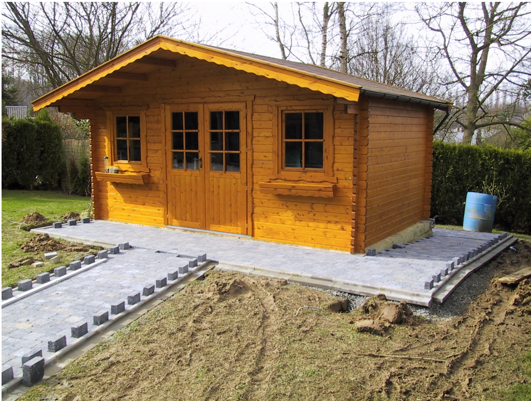
Pavage en pavés béton 15x15x6 – Bordure béton pour tondeuse