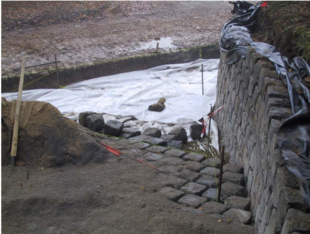
Réalisation de murs en vieux pavés de réemploi (Porphyre Belge 15x15) Vieux pavés