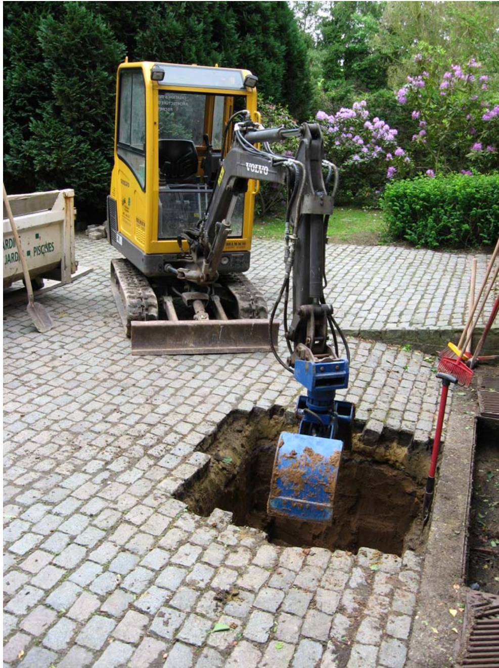
Réalisation d'une chambre de visite, avec installation d'une pompe de relevage pour eaux usées.