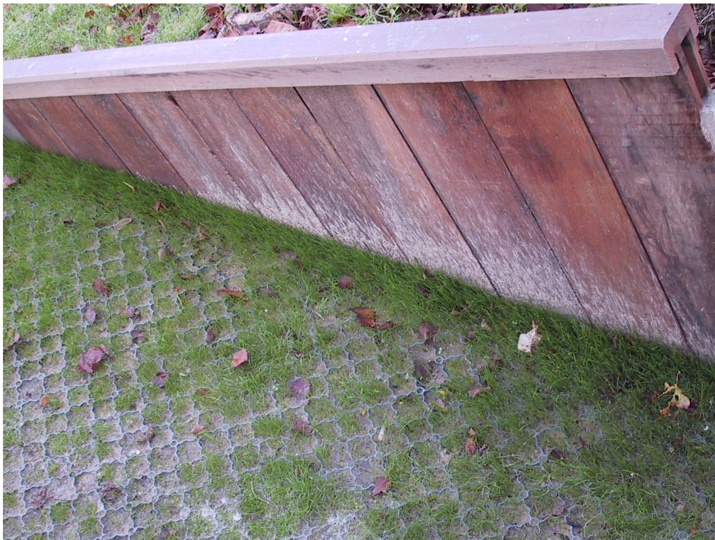
Palplanches en Azobé avec profil de finition Dalle gazon en PVC