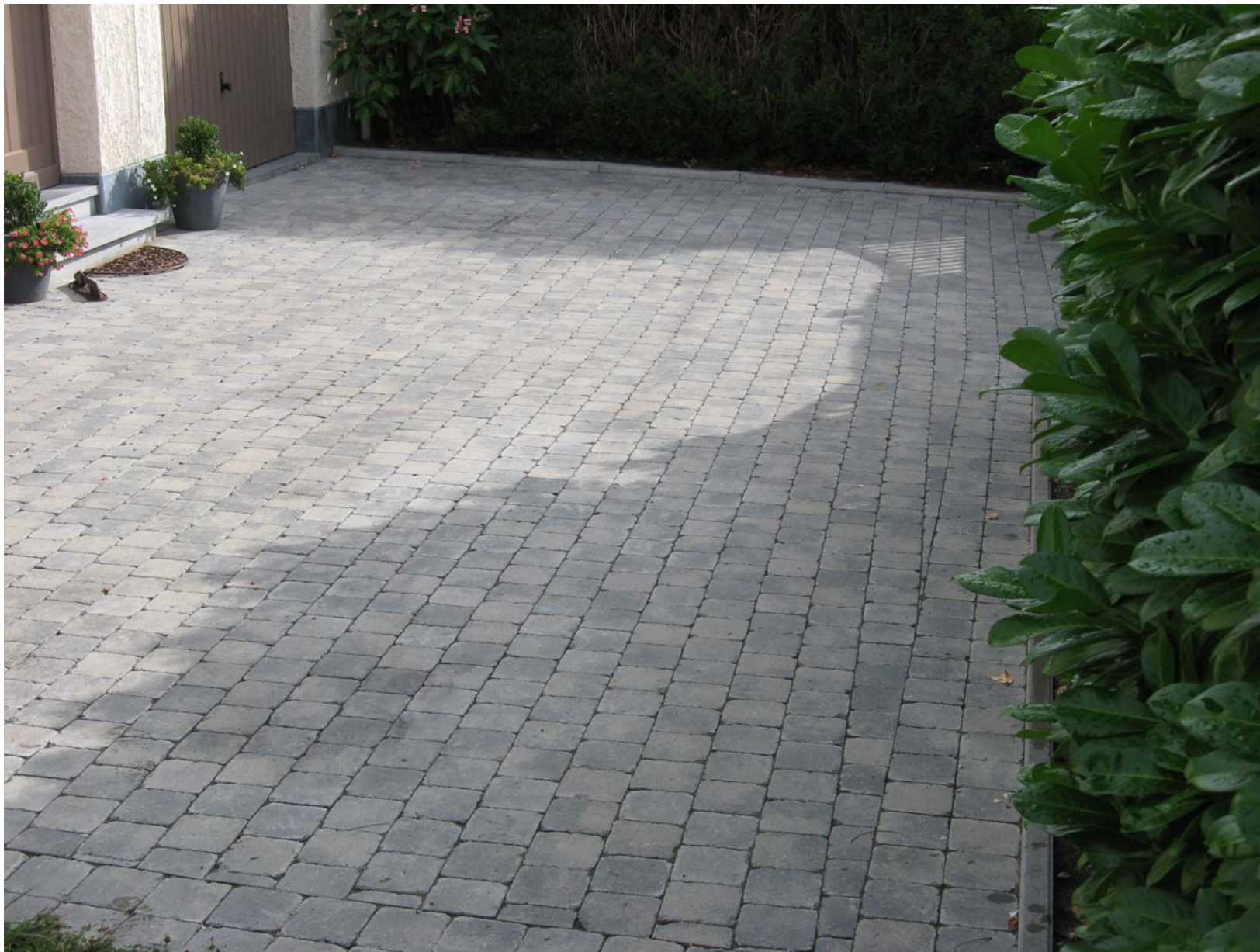
Pavage en pavés béton « tégulas » 15x15x6 gris – Réalisation cadre sur le pourtour, pavés à joints alternés