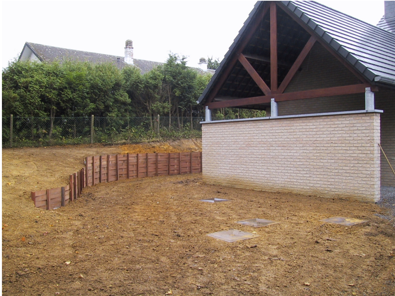
Clayons en Azobé – Hauteur 1m