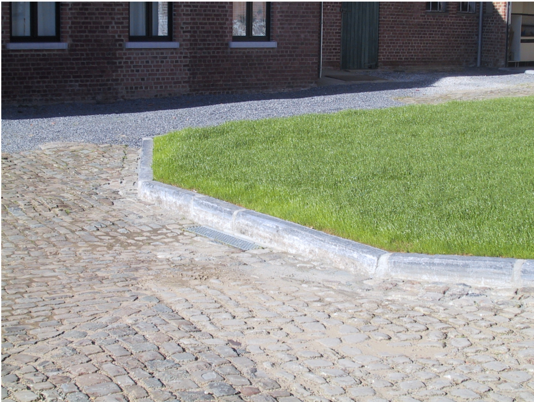
Pose de bordures de route de récupération – Egouttage