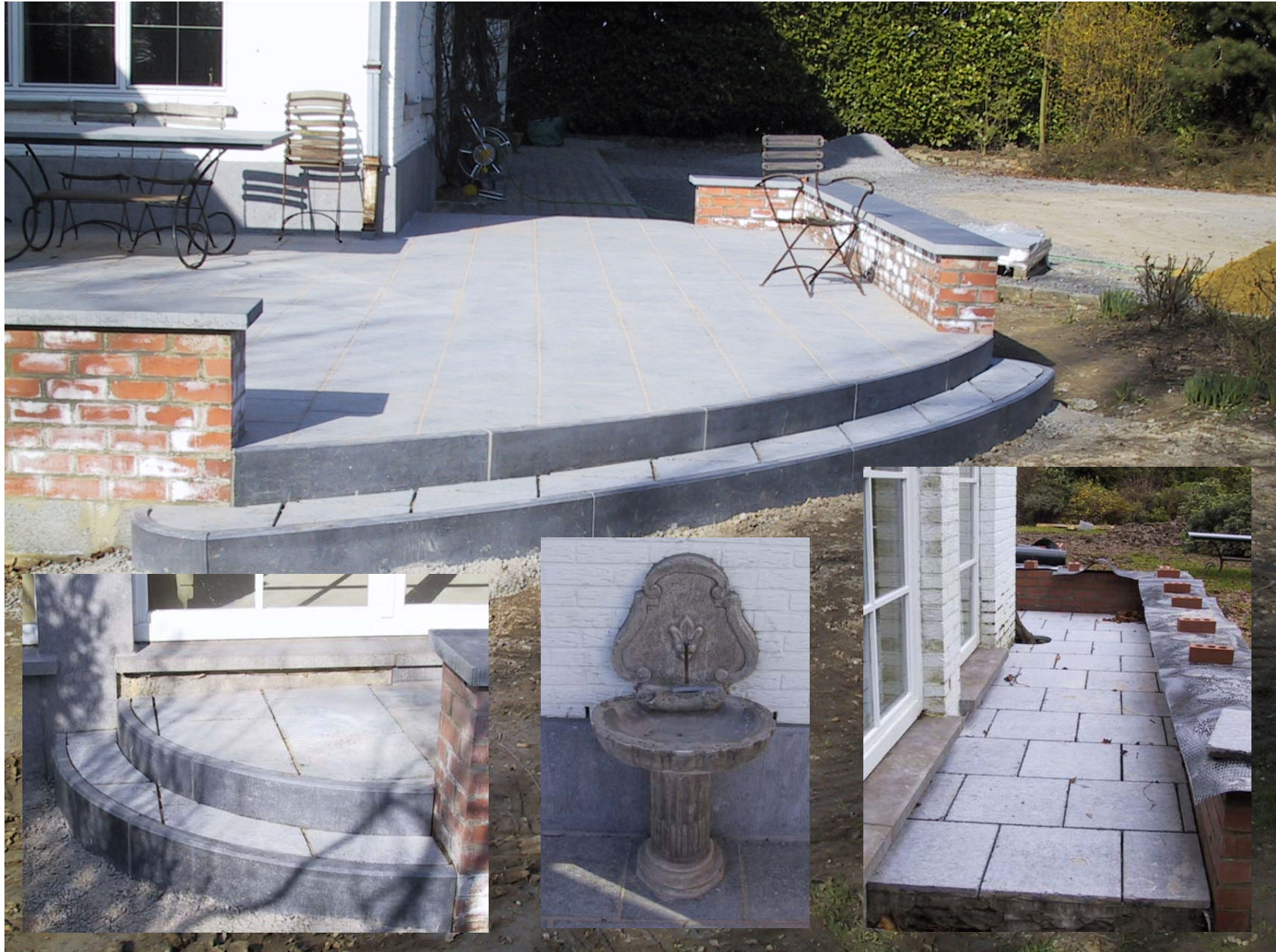
Terrasse en Pierre Bleue du Hainaut 40x40x3 – Finition adoucie