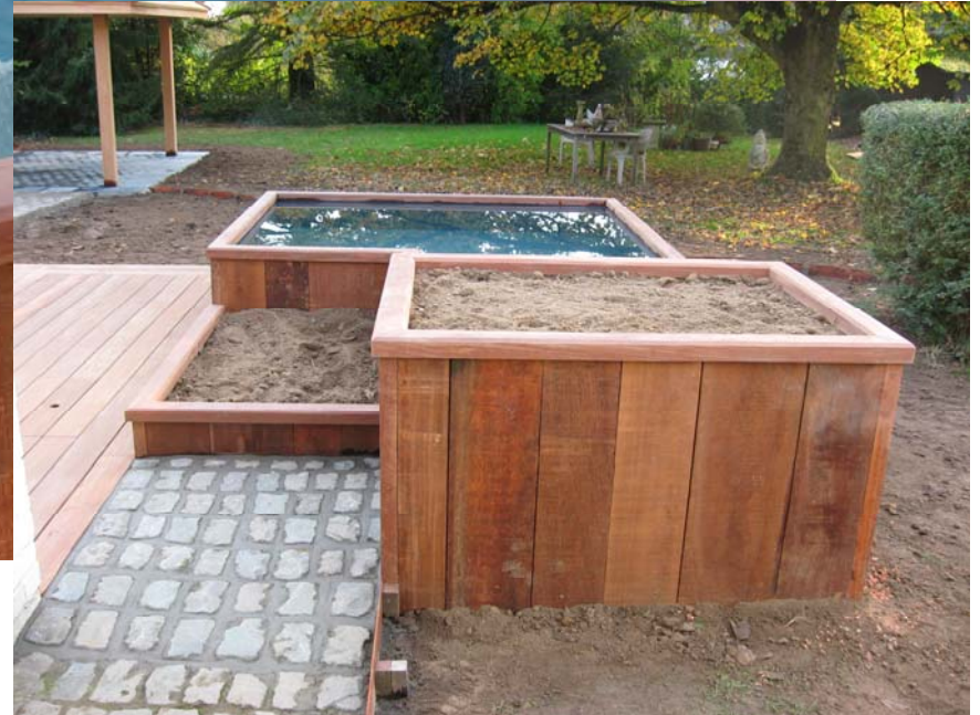
Palplanches en Azobé avec profil de finition Lattes en Azobé pour délimitation de parterres