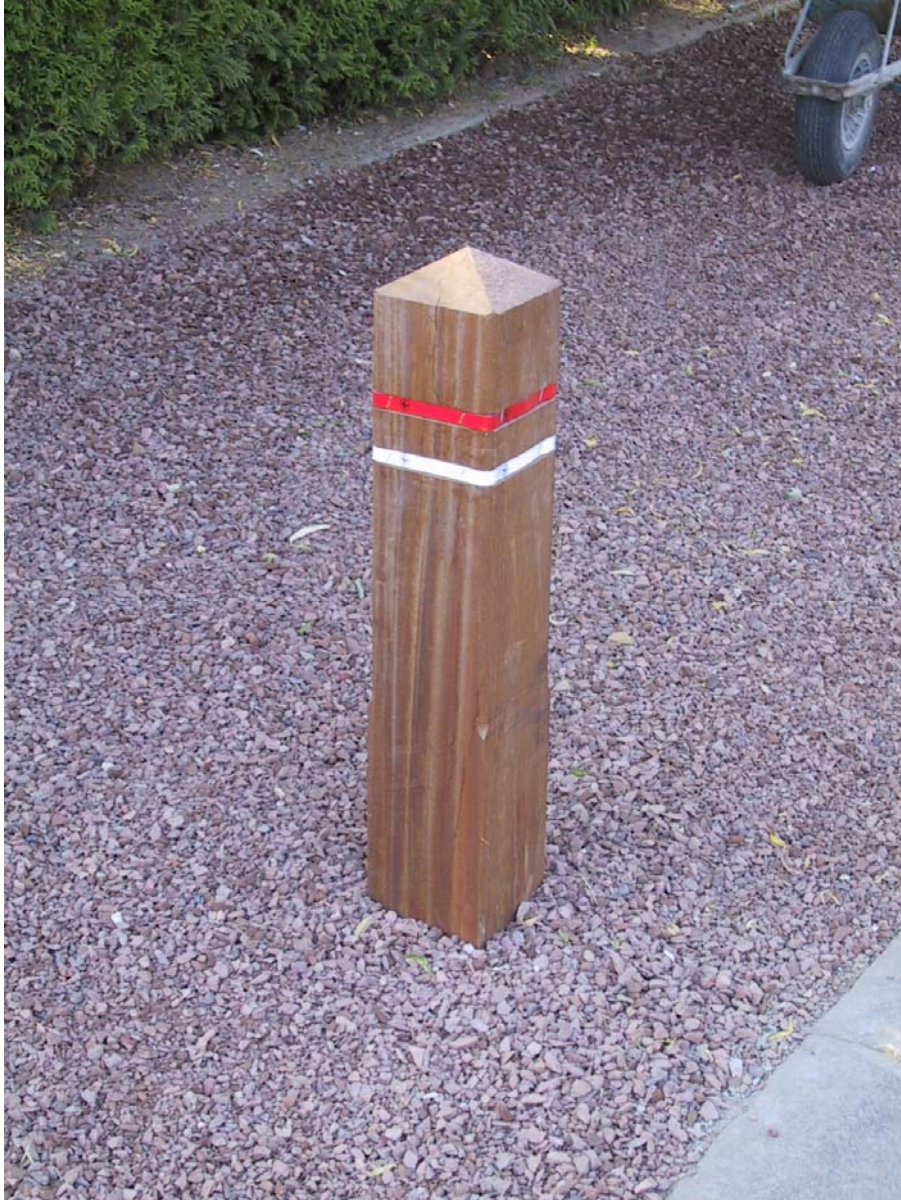
Pose de bollards en Azobé (15x15x120)