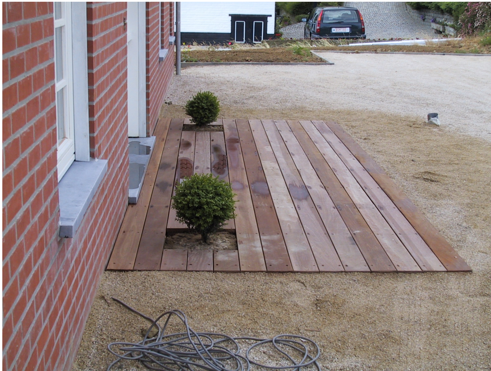
Terrasse en bois « IPE » avec fixations visibles en Inox et réservations pour plantes