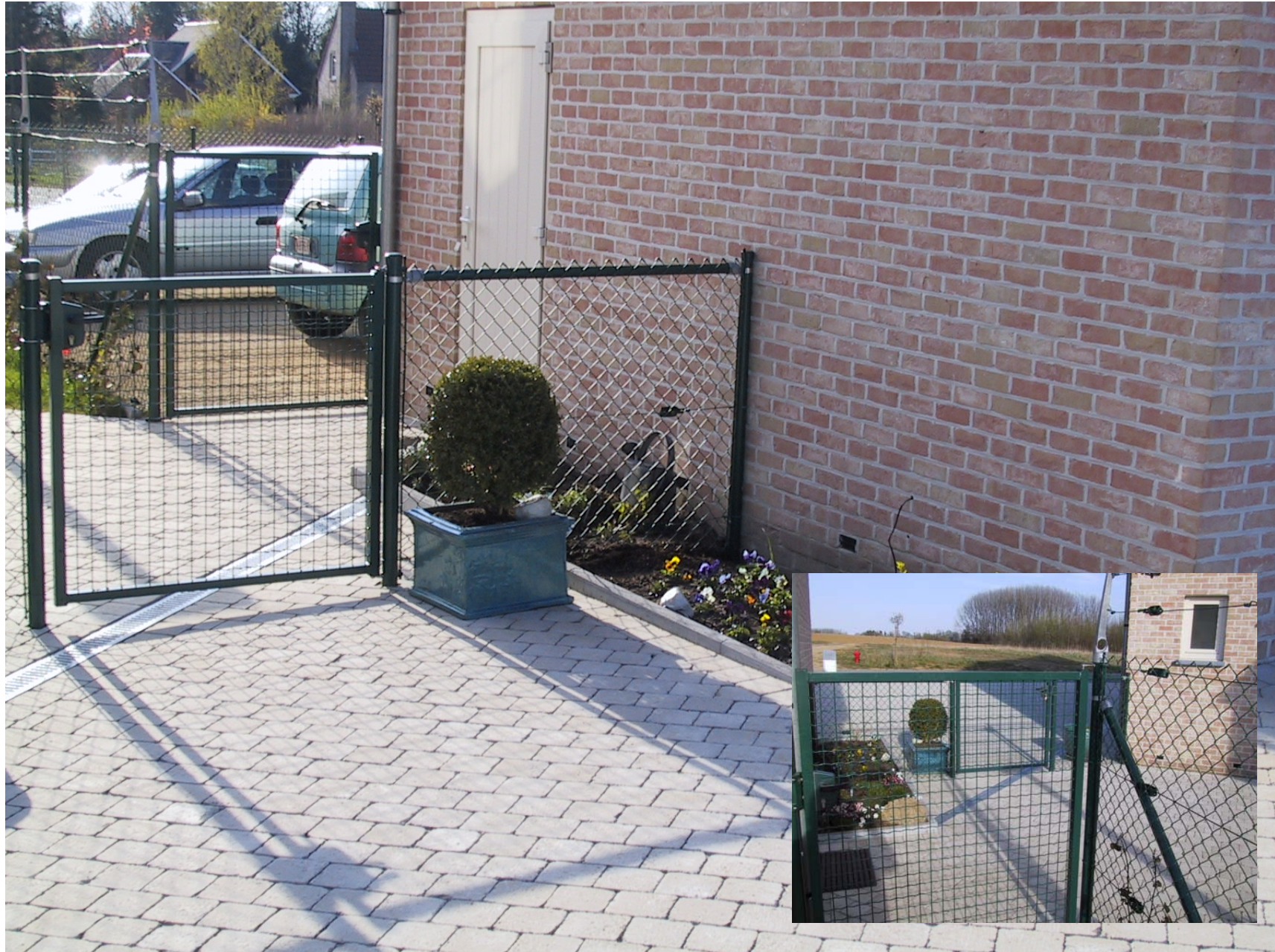
Pavage en pavés béton 15x15x6 – Bordure béton 100x20x6 – Clôture type « plasitor »