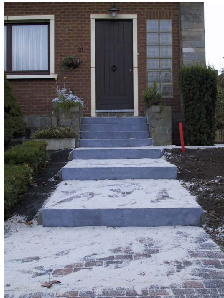
Réalisation de palier avec nez de marche en pierre bleue.